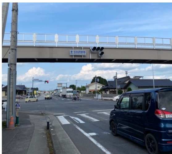
② 大原間南交差点を直進すると 左手にかめやさんが見えてきます