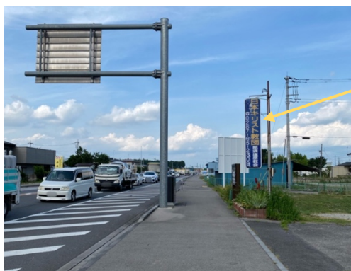
③ かめやさんの反対側（向かって右手側）に 日本基督教団さんの看板があるので 日本基督教団さんの奥の白い大きな看板 のすぐ奥を右に曲がって下さい。