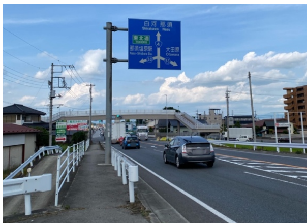
① 4号白河・那須方面を直進