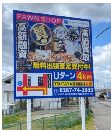
(※看板は PAWN SHOP さんの看板になります)